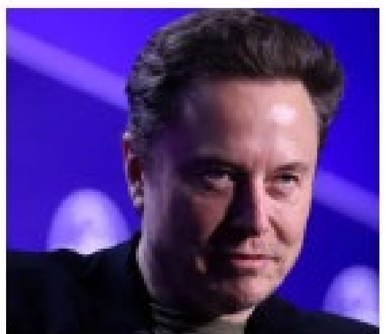
Juan Manuel Santos

Além disso, ele afirmou que o horário eleitoral é um espaço de exercício democrático de informação e participação política.