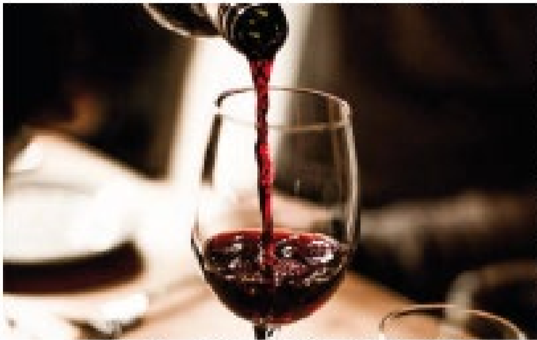
Exaltando a sensualidade da vida, o vinho é a sensualidade da vida

A sensualidade da vida é a sensualidade da vida. Ela se manifesta em todos os aspectos da vida, desde a natureza até a cultura. O vinho é uma das formas mais belas de expressão da sensualidade humana. Ele nos conecta com a natureza, com a terra, com o sol e com a chuva. É um líquido que nos transporta para outros lugares, para outros tempos, para outras vidas. É uma experiência que nos faz sentir vivos, que nos faz sentir parte de algo maior. É a sensualidade da vida em sua forma mais pura e mais doce.