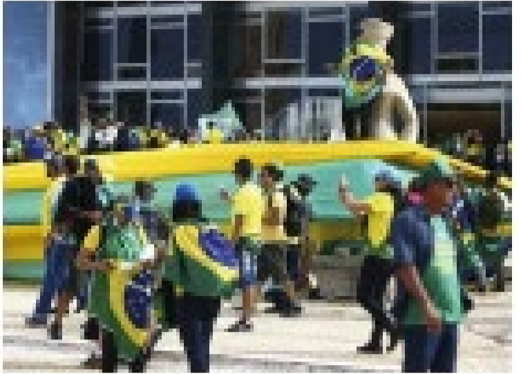
Atenas-Festa dos Tufanos em frente ao palácio Arco-Íris.

A Polícia Federal realizou duas mandados de busca e apreensão em Goiás e mais três estados sobre golpistas. O objetivo é identificar e apreender documentos e bens relacionados às atividades criminosas.