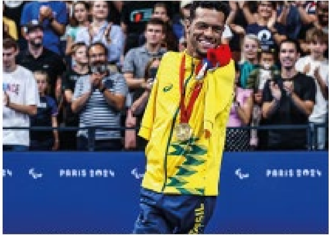
Tênista Gabriel Araújo em ação na Paris 2024 durante o jogo final.

A vitória de Araújo não só marcou o primeiro ouro do Brasil no tênis masculino em Paris, mas também marcou o primeiro ouro do Brasil no tênis masculino em qualquer edição dos Jogos Olímpicos.