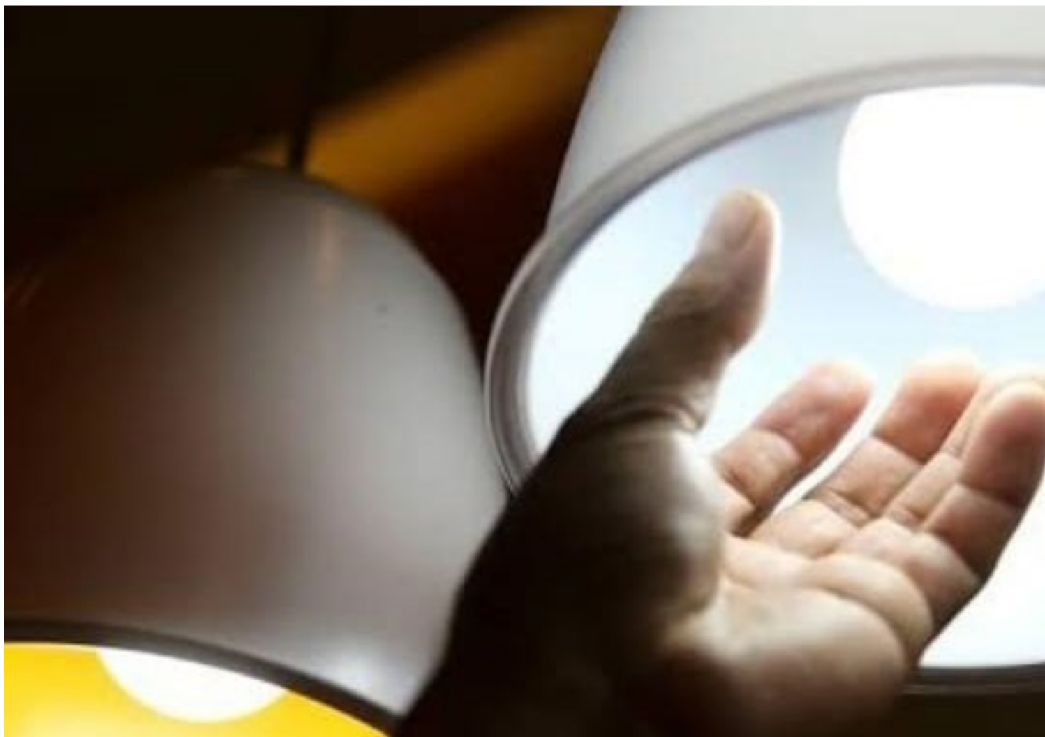
Aumento no custeio do sistema chegará no bolso do consumidor

Segundo a Agência Nacional de Energia Elétrica (Aneel), escassez de chuva, clima seco e temperaturas altas motivam decisão