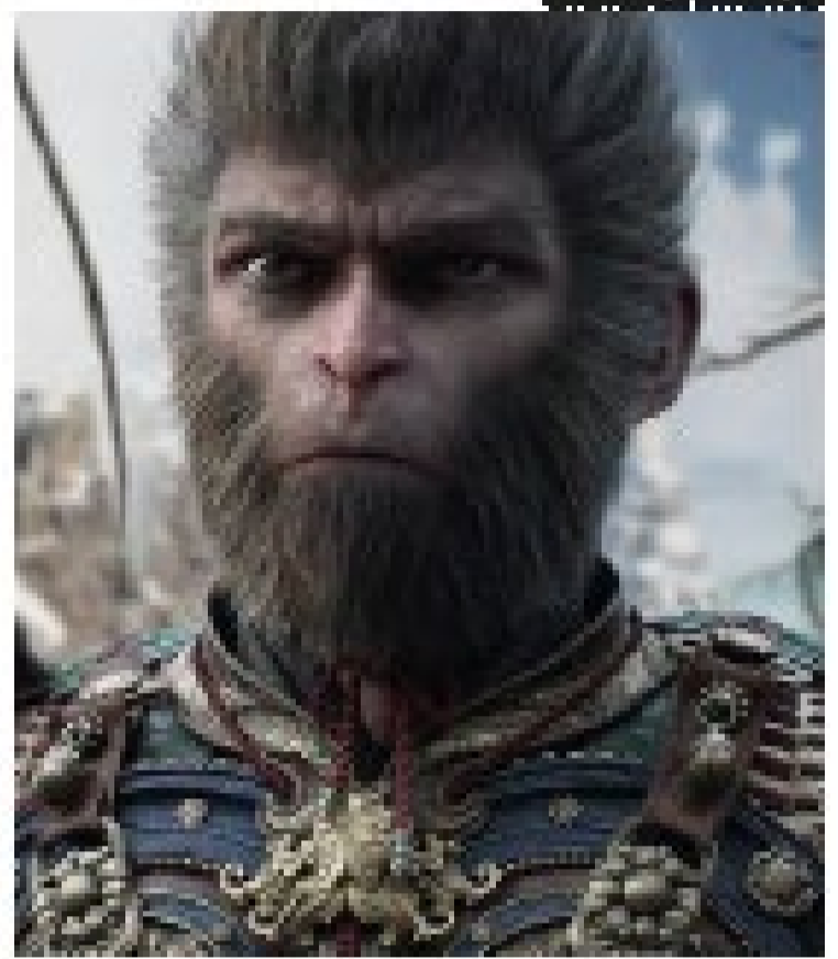
Personagem do jogo Black Myth: Wukong.

Jogo narra a jornada do herói e do público. O jogo narra a jornada do herói e do público. O jogo narra a jornada do herói e do público.