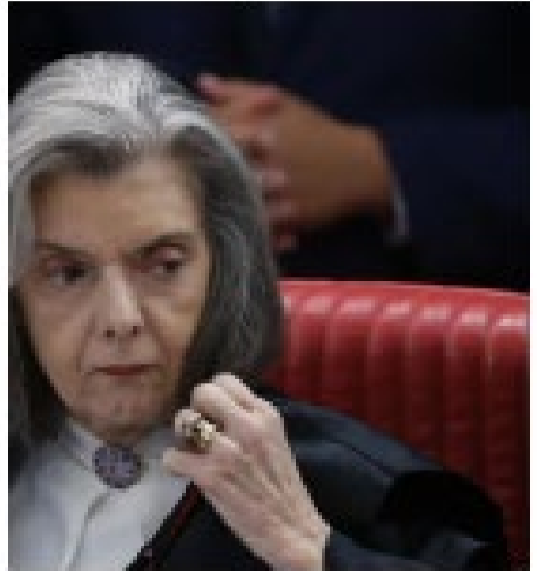
Cármen Lúcia, ministra da Justiça e presidente do TSE, afirmou que o horário eleitoral é um espaço de exercício democrático de informação e participação política.

Além disso, ele afirmou que o horário eleitoral é um espaço de exercício democrático de informação e participação política.