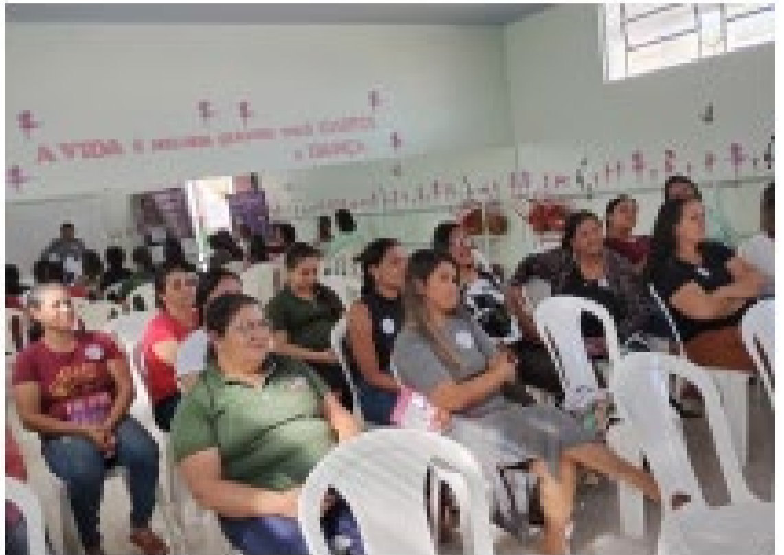
Capacitação para enfrentar a violência contra a mulher

A capacitação tem como objetivo fortalecer as ações locais e promover a integração entre os serviços sociais e de saúde.